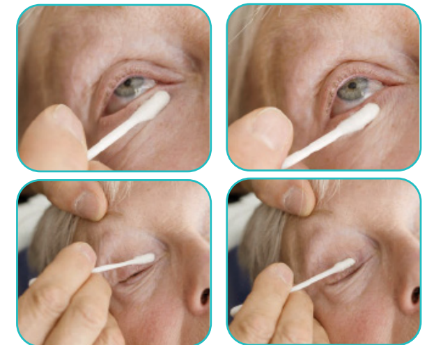
Ooglidhygiëne bij posterieure ooglidrandontsteking

Bij posterieure ooglidrandontsteking kunt u de talgkliertjes leegstrijken aan de hand van een droog wattenstaafje . Maak met het wattenstaafje masserende verticale bewegingen richting de ooglidrand. Oefen daarbij voldoende druk uit. Zorg er opnieuw voor dat u het oog zelf niet aanraakt.