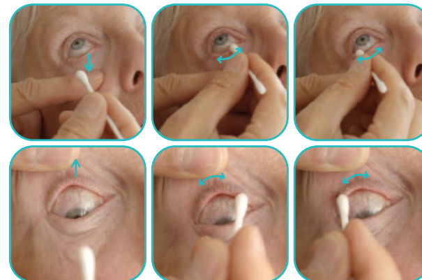
Ooglidhygiëne bij anterieure ooglidrandontsteking

Bij anterieure ooglidrandontsteking kunt u de korstjes verwijderen met babyshampoo en een wattenstaafje. Los 2 à 3 druppels babyshampoo op in een glas met warm kraantjeswater . U kunt eventueel ook een speciaal reinigingsproduct gebruiken van de apotheeker.